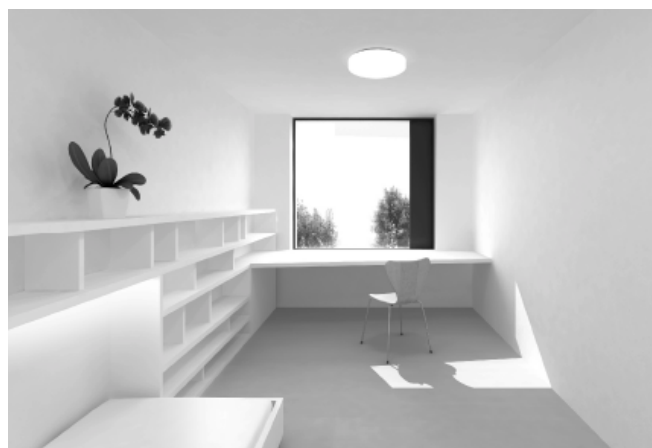
1 er prix: chambres étudiants