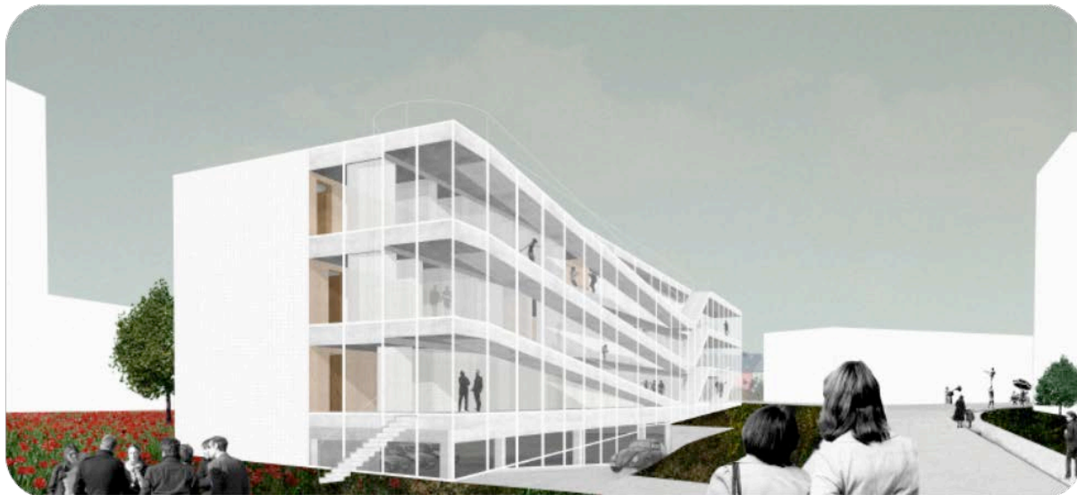
Mention: façade principale