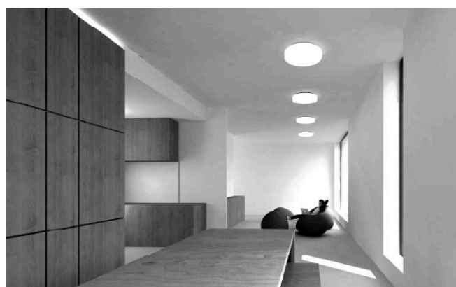
1 er prix: espace commun