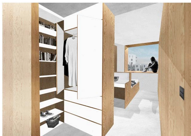
Mention: chambres étudiants