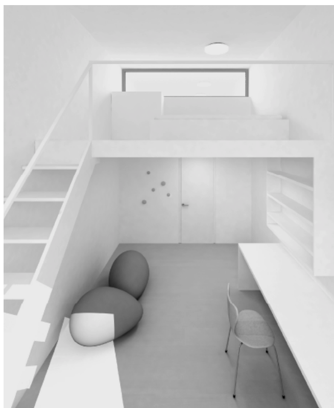
1 er prix: chambres doctorants