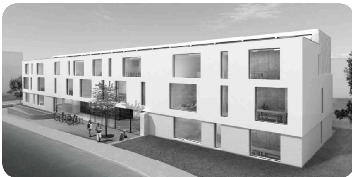
1 er prix: façade principale